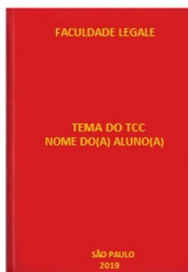
Monografia * Capa dura cor Rubi ou Vermelha com letras douradas.